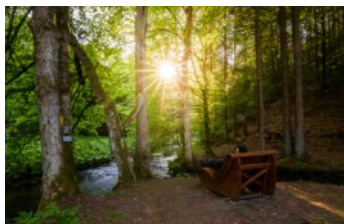
22-Ort der Stille