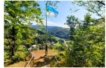
12-Rotherfelsen - „Fahne“